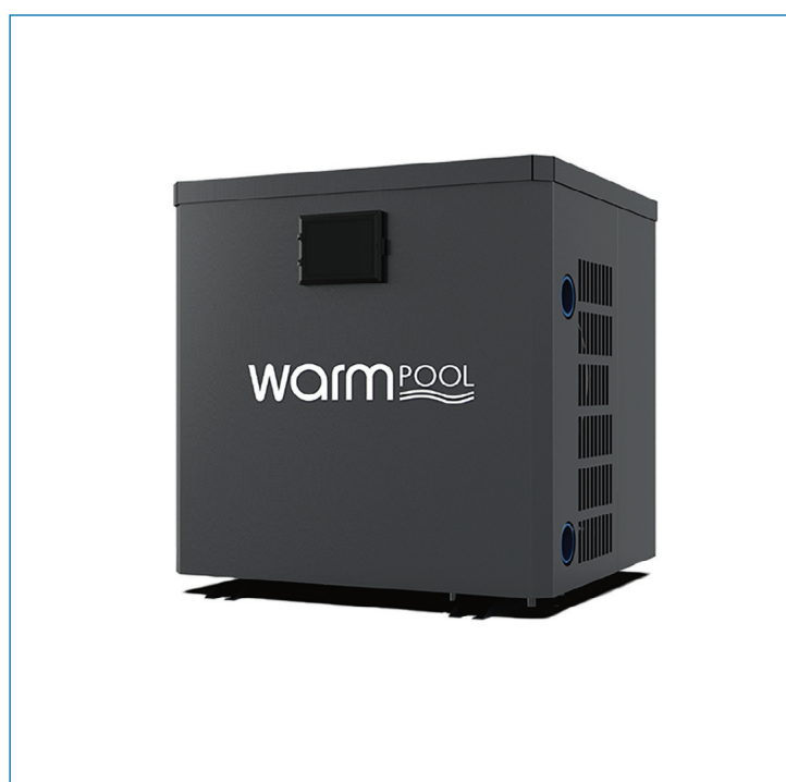
Pompe à chaleur Minipac Cube Warmpool

Dans ce dossier pleinement consacré à la construction de la piscine, toutes les informations sont là pour que vous imaginiez votre futur espace aquatique. De la taille et de la forme du bassin aux différents procédés de construction, en passant par les revêtements, les abords et les équipements, voici les clefs pour bâtir, avec votre piscinier, cette piscine dont vous rêvez. Consacrez à ce projet le temps nécessaire ; parce que c'est le vôtre et qu'il mérite conseils et attentions. Avant de le vivre et d'en profiter pendant des années et des années.