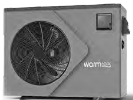
Nouvelle PAC DC35

en mono ou en triphasé. Les petits bassins peuvent ainsi bénéficier d'une puissance en triphasé.