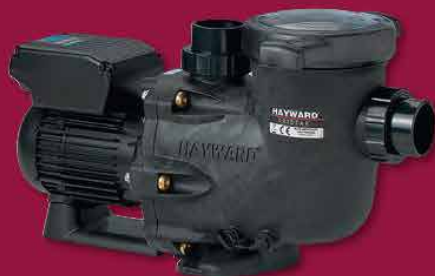
Pompe de filtration TriStar VSTD (Hayward)