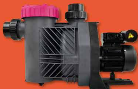
Pompe de filtration Eurostar HF (BWT)