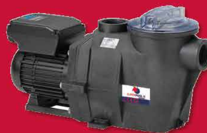
Pompe à vitesse variable Superpool II VS (SCP)