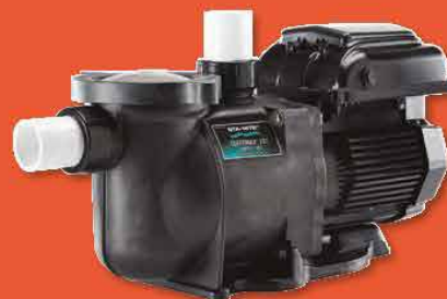
Pompe à vitesse variable STA-RITE Supermax® VS2 (Pentair)